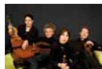
"Alte Schule" Jagdschloss Springe Minguet Quartett