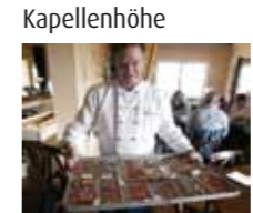
Kloster Loccum Kloster-Refektorium Kapellenhöhe Leckere "Chocolate"

Rehburg/Loccum - Wölpinghausen Wie es sich früher angefühlt hat, als Mönch im Kloster zu leben, das erfahren wir bei einem geführten Rundgang durch das mittelalterliche Zisterzienserkloster Loccum.