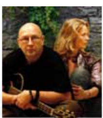
Antikriegswerkstatt Ein "DankMal" Die Kunstwerkstatt Duo "The Songliners"

Lehrte - Sehnde Ausstellungen, Vorträge, Lesungen, Kultur-aufführungen und Seminare: Am Platz der historischen Schlacht von Sievershausen (1553) wurde in einem alten Bauernhaus und auf dem umgebenden Gelände auf der Basis der Antikriegswerkstatt eine Stätte der Aktivitäten rund um die Friedensarbeit eingerichtet. Wir erfahren allerlei Interessantes über den Trägerverein „Dokumentationsstätte zu Kriegsgeschehen und Friedensarbeit Sievershausen“ und besichtigen die Denkmäler und die Kirche auf dem Gelände.